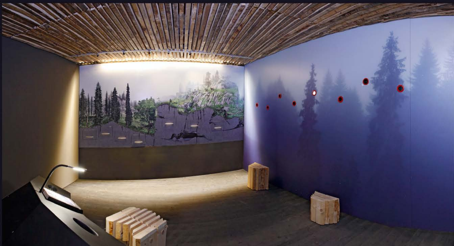
Blick in den Erlebnisraum