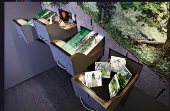
Wimmelbild von Andrea Klaiber, 7 Schubladen mit Objekten und Informationen