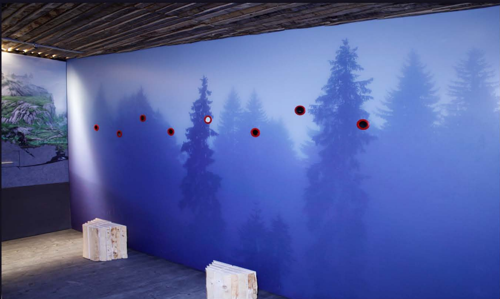
Wand mit acht Gucklöchern, in denen z.B. ein 28'000 Jahre alter Zahn eines Höhlenbären, die seltene Engelshaarflechte oder ein Dreizehenspecht im Video zu sehen sind