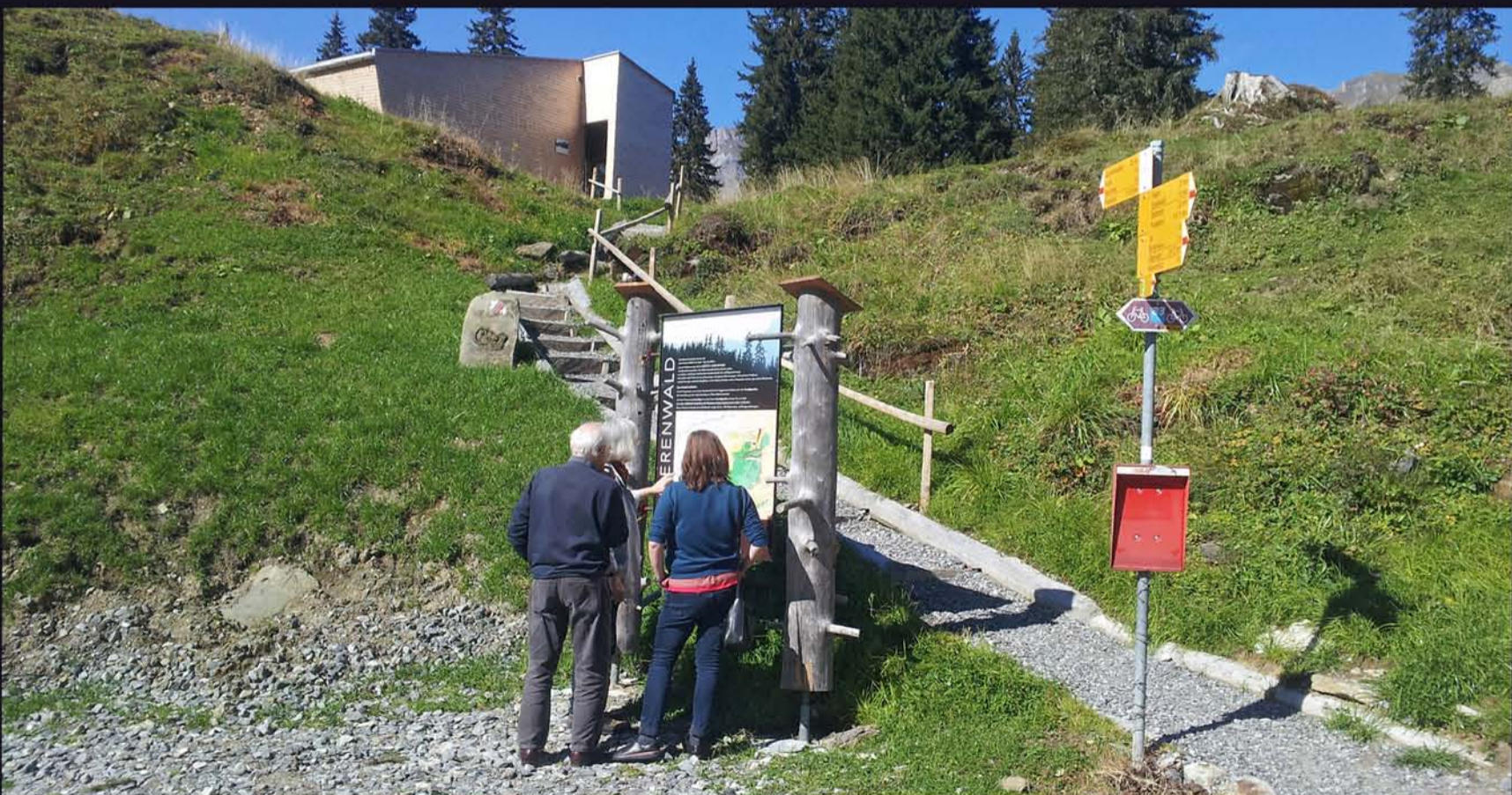
Zustieg mit Infotafel