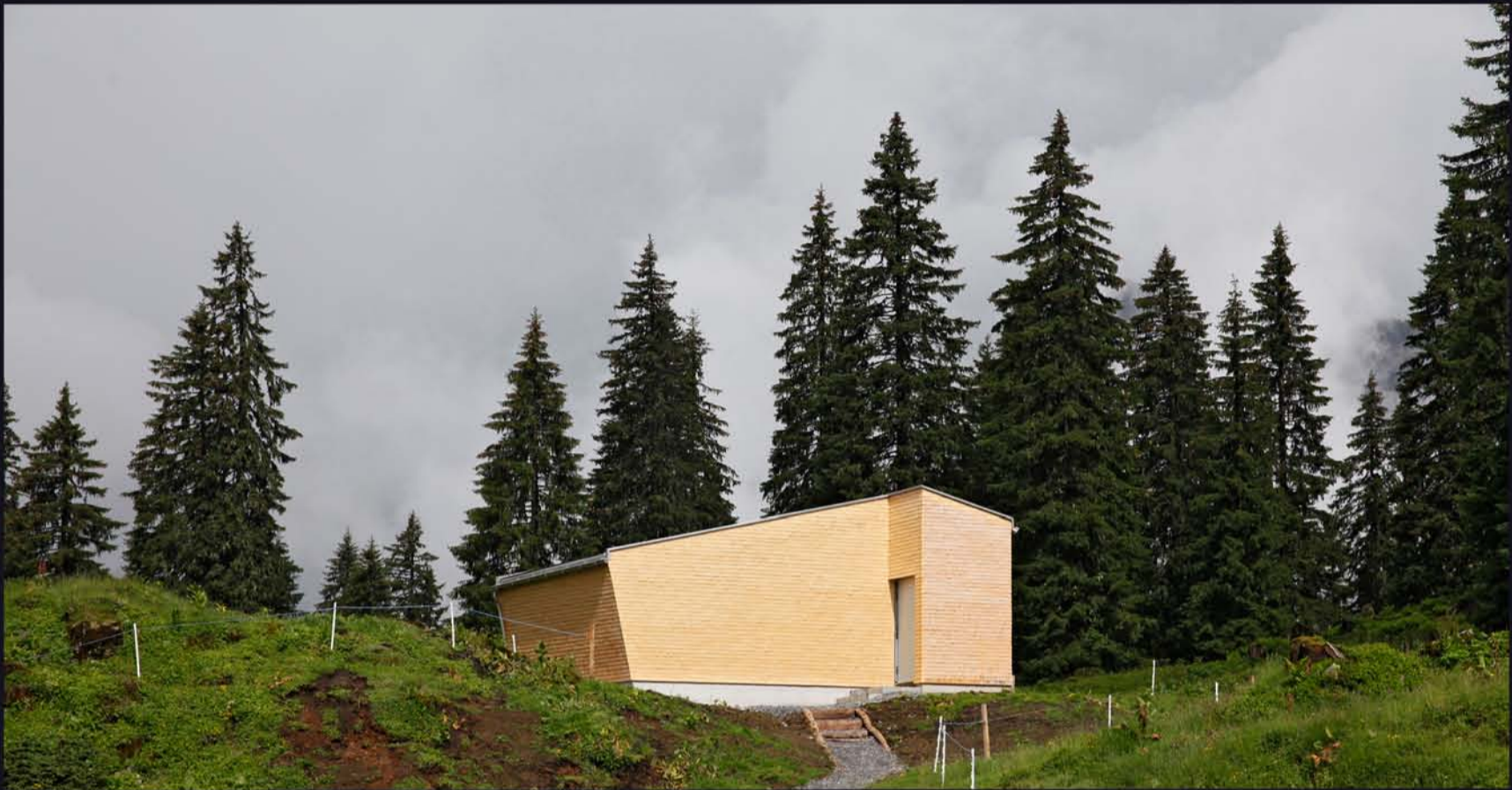
Pavillon bei Unter Roggenloch , Architektur von ARDE, Brunnen