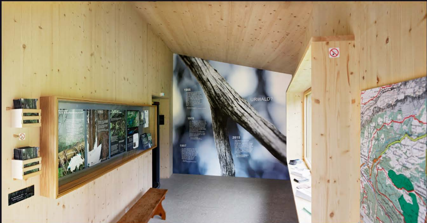
Blick in den Vorraum

Konzept und Realisierung: Christoph Schütz